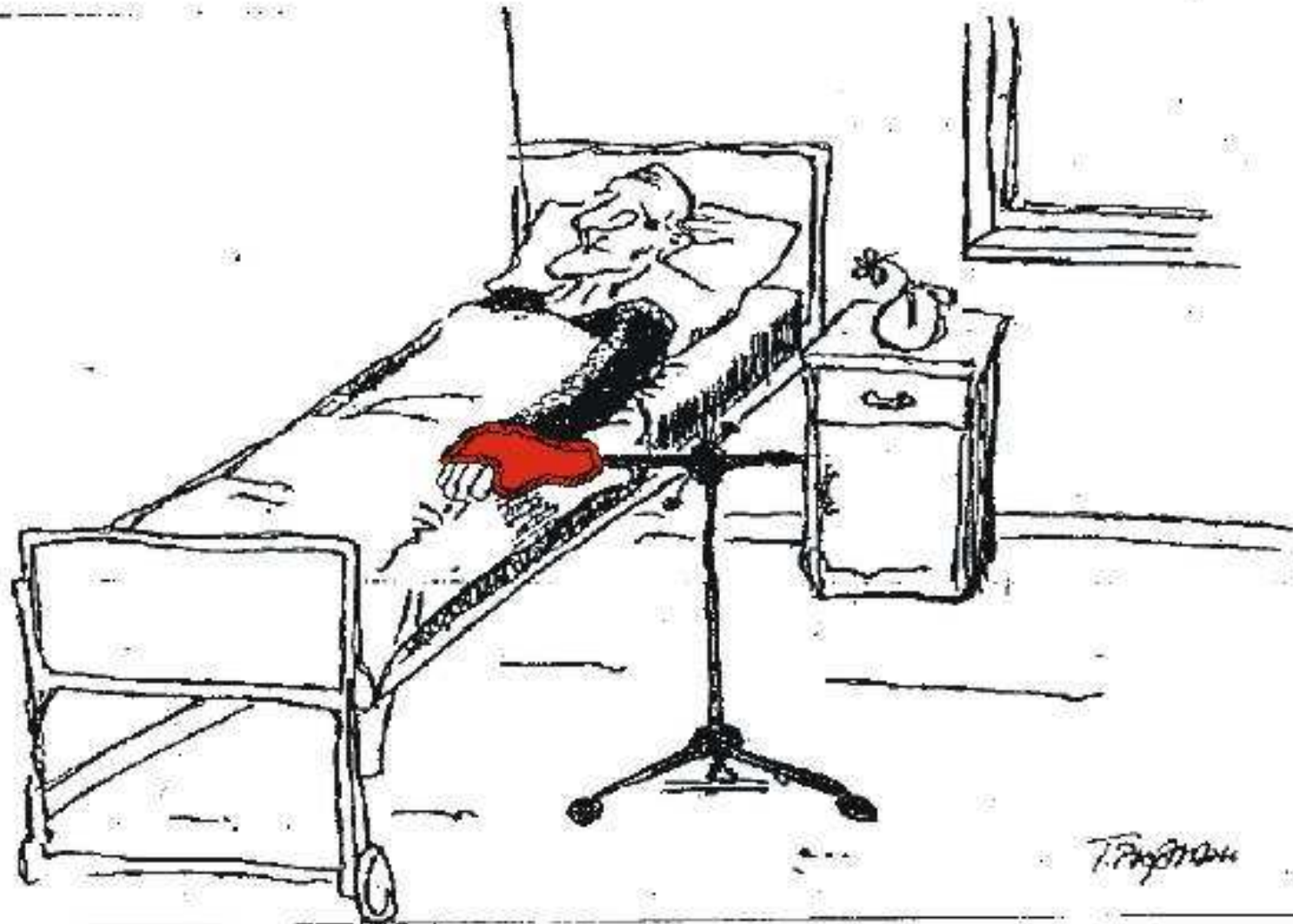
Zeichnung: Thomas Pläßmann